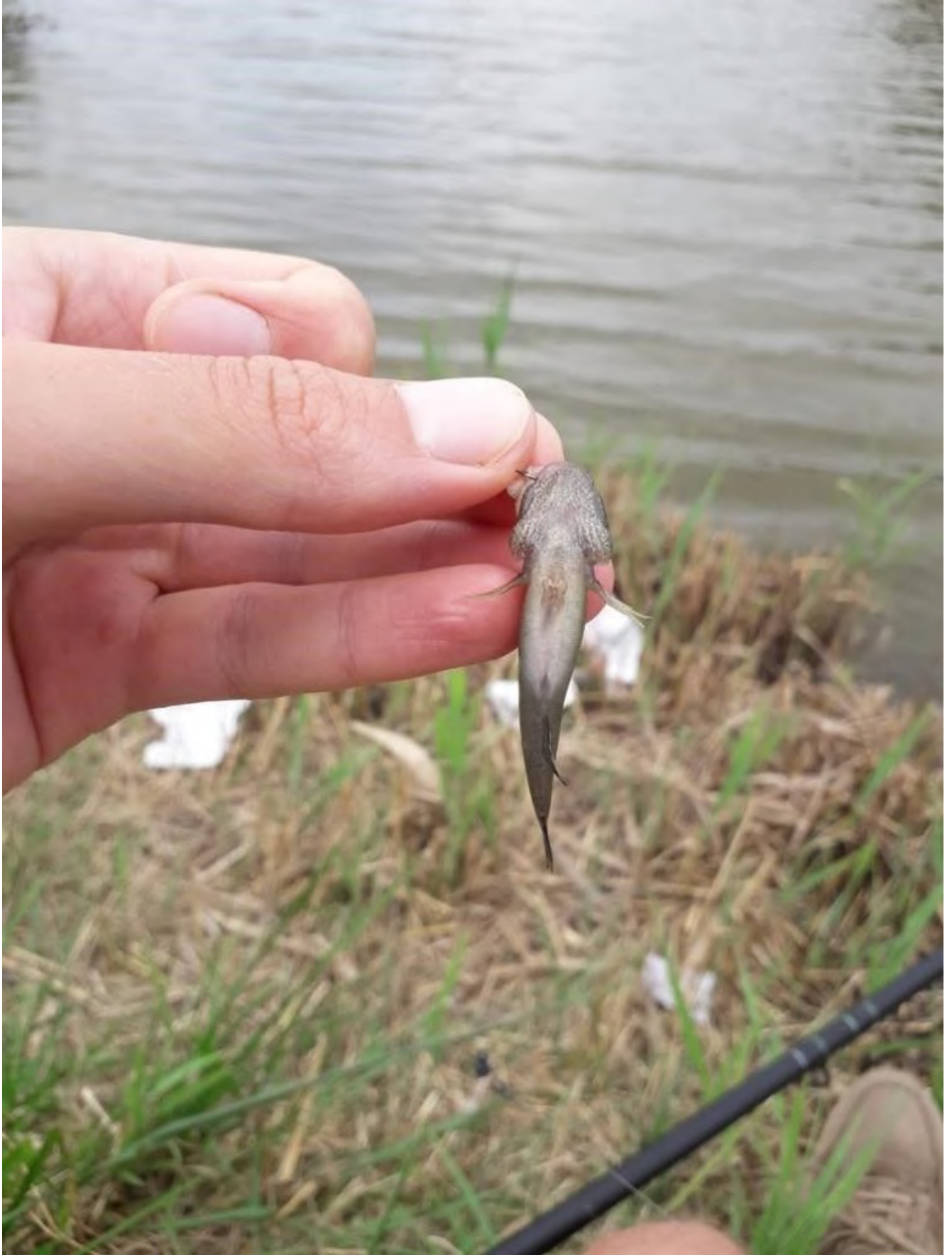
Figuur 3: de marmertekeningen op de onderkant van de kop van de shimofurigrondel