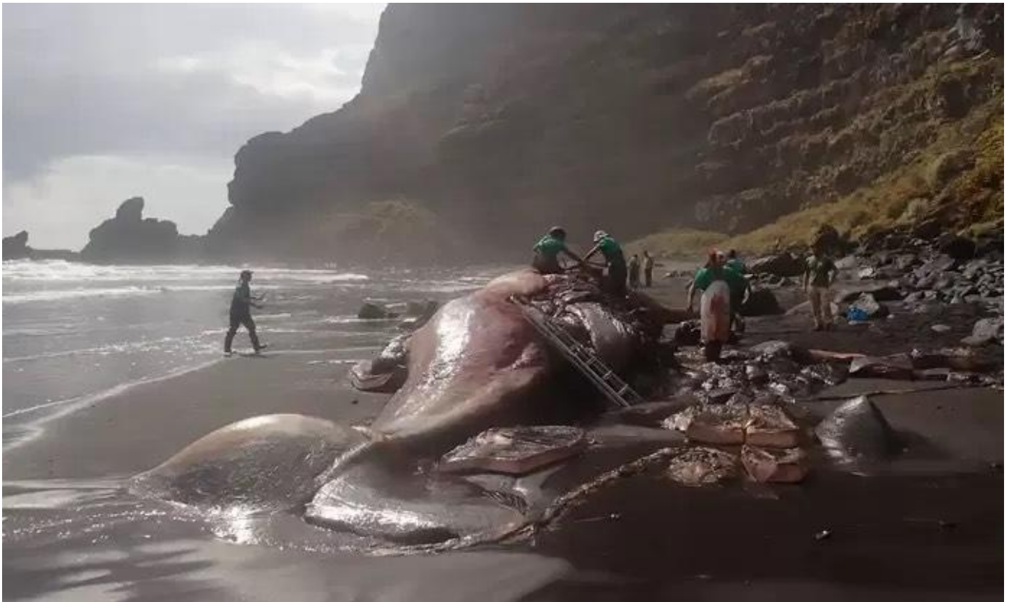
Wetenschappers inspecteren de aangespoelde walvis op La Palma.

Ambergrijs ontstaat in de ingewanden van de potvis. Hoe dan? Potvissen zijn dol op inktvissen die ze met rugschild en al verorberen. Het meeste daarvan wordt niet verteerd en uitgebraakt. Soms wordt het goedje ook uitgescheiden en drijvend op zee aangetroffen. Maar af en toe, zoals in het geval van de walvis op La Palma, wordt de klomp te groot, waardoor de darm scheurt en de walvis sterft.