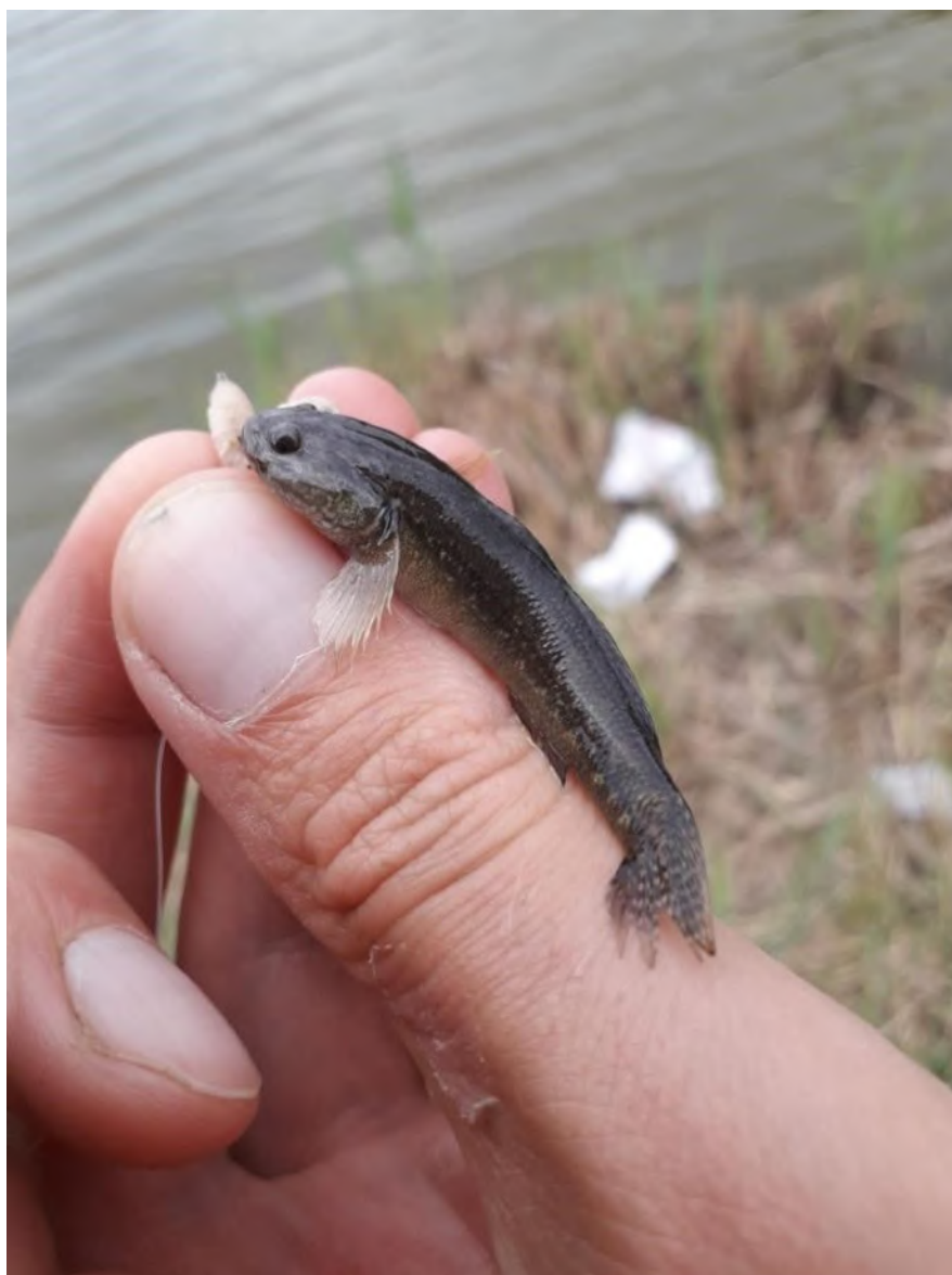
Figuur 2: een van de drie aangetroffen shimofurigrondels bij Biervliet op 4 augustus 2022

Exotische grondels blijven regelmatig langere tijd onder de radar. Ze komen in verschillende kleuren en maten voor en hebben een grote diversiteit verspreid over de wereld. Door hun onopvallende verschijningsvorm en het leven op de bodem van wateren, vallen ze vaak niet op en weten veel mensen ze niet goed te determineren.