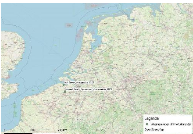
Figuur 1: waarnemingen van de shimofurigrondel in Nederland en Vlaanderen

Op 4 augustus 2022 werden er met een hengel drie tot dan toe onbekende grondels gevangen in het Uitwateringskanaal Nol Zeven bij Biervliet (Figuur 1 en 2). Op basis van waarnemingen van shimofurigrondels ( Tridentiger bifasciatus ) die op 6 november 2022 werden aangetroffen in het kanaal Gent-Terneuzen, beschreef het INBO (Instituut Natuur- en Bosonderzoek, Vlaanderen) de vondst van een nieuwe vissoort voor Europa. Uit dit artikel werd direct duidelijk dat het om dezelfde soort ging als eerder bij Biervliet.