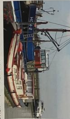
De HON 2 in het dok bij De Klerk. De 17,6 meter lange HON 2 is in 1965 gebouwd door De Klerk en nog altijd in originele staat. Het keuring onderhouden voortuing wordt alleen nog gebruikt voor recreatieve doeleinden.