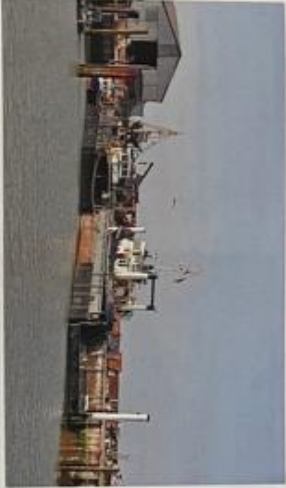
WALSOORDEN – Het nog enige havenje langs de Westerschelde waar in- dustrie- en pleziervaart samen gaan roakt in ver- vol. De gemeente Hulst wil n het otfopen van de erf- pocht met het Rijk het ho- venje overnemen. De on- derhandelingen duren erg lang. De gebruikers zijn inmiddels voor het zesde oor in otwachting wat er met het havenje staat te gebeuren.

„Sinds de fusie van de ge- meenten Hontunisse en Hulst zijn er geen structurele investeringen meer gedaan in de infrastructuur van de haven die blijft aan de aanbieder van de haven. Als het Rijk niet constructief worst me- te werken voor de overdracht van de haven aan de gemeente Hulst,