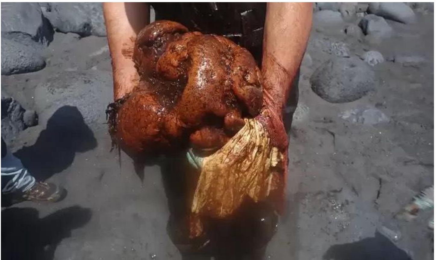
De grote klomp ambergrijs die werd aangetroffen in de aangespoelde walvis op La Palma.

In 2021 was er drie maanden lang intense vulkanische activiteit op het eiland. De eruptie duurde uiteindelijk 85 dagen en 18 uur. De schade van de uitbarsting wordt geschat op meer dan 900 miljoen euro. Of de klomp ambergrijs werkelijk 500.000 euro gaat opbrengen, valt nog af te wachten - maar de onverwachte vondst kan het leed al een beetje helpen verlichten.