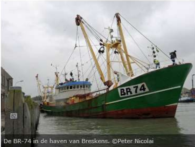
De BR-74 in de haven van Breskens.

YERSEKE - Misschien staat er volgend jaar wel een groot projectbord met de vlag van de Europese Unie op de haven in Yerseke.