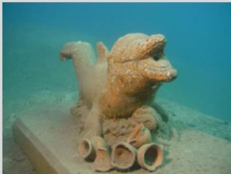
Flipper - © Frank Peeters

Om de duikstek aantrekkelijker te maken werden er onderwater kunstwerken geplaatst. De tentoongestelde objecten leunen sterk aan bij het tuinbeelden-genre (trollen, bustes,...) of zijn abstracte knutselwerken van kunstenaars van bij ons. Zo is er bijvoorbeeld "het Oog van God", volledig in RVS met aanduiding van de vier windstreken. Verder liggen er nog verscheidene silo's onder water waar je doorheen kan zwemmen, een duikersklok.