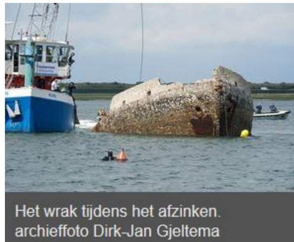
Het wrak tijdens het afzinken.

De diepte waarop de Serpent uiteindelijk terecht is gekomen (27 meter in plaats van het beoogde maximum van 12) maakt wel dat de initiatiefnemers de pijlen nu richten op een andere doelgroep. Rijkswaterstaat en NOB hebben nadrukkelijke voorwaarden gesteld voor een duik op de Serpent bij Scharendijke. Het wrak is niet geschikt voor onervaren duikers.