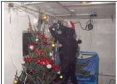
De duikers in het onderwaterhuis.

In de boom hangen houten ballen en golfballen. Er kunnen geen echte kerstballen in want die knappen onder water. Daar is een andere druk.