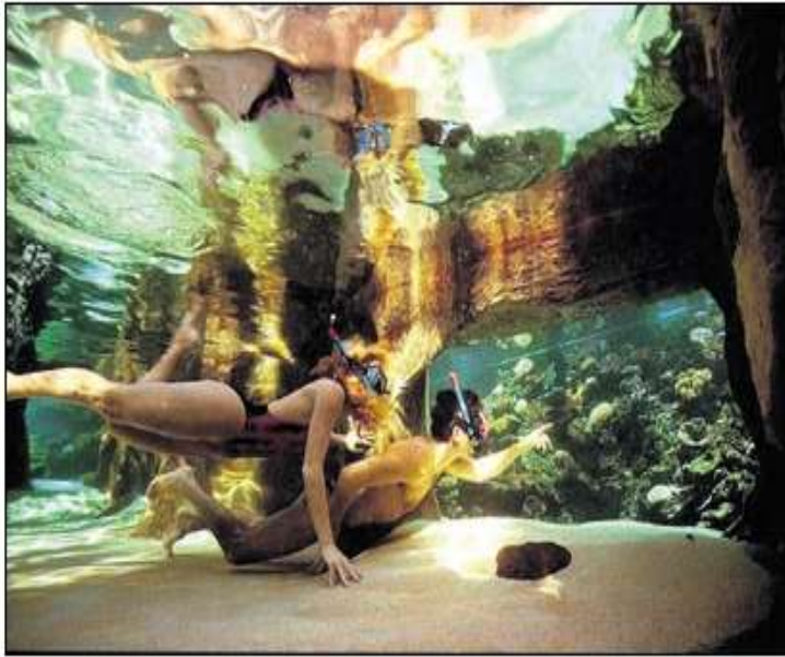
'Aquarium' met zeshonderd vissen, waaronder de witvinhaai.

Het liefst hadden ze hun gasten echt laten zwemmen tussen de vissen. Maar helaas, zwembadwater moet aan andere eisen voldoen dan water in een zeeaquarium. Maar Het Leven in Zee Bad in de Kempervennen van Center Parcs komt dicht in de buurt.