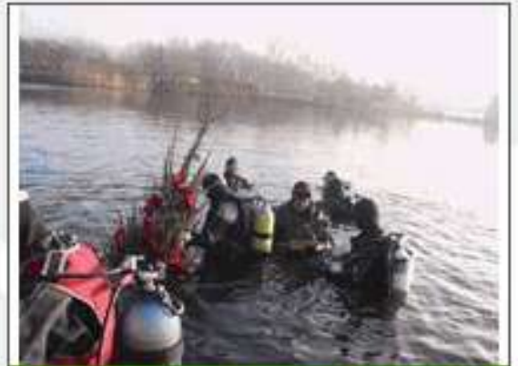
De kerstboom wordt het water ingetild.

17 meter onder water hebben duikers vandaag een kerstboom geplaatst. De boom is versierd met speciale ballen want de echte kerstballen knappen onder water.