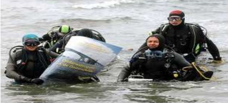
Vier duikers presenteerden gisteren de nieuwe folder voor de onderwatersport in de Oosterschelde.

WEMELDINGE - De Nederlandse Onderwatersportbond (NOB) wil vijf grote schepen laten afzinken in de Zeeuwse wateren. Drie in de Oosterschelde, één in het Veerse Meer en één in de Grevelingen, zo stelde bestuurslid M. Waijers gisteren. Met die wrakken krijgen de duikers er vijf fantastische duikstekken bij, voorspelde hij.